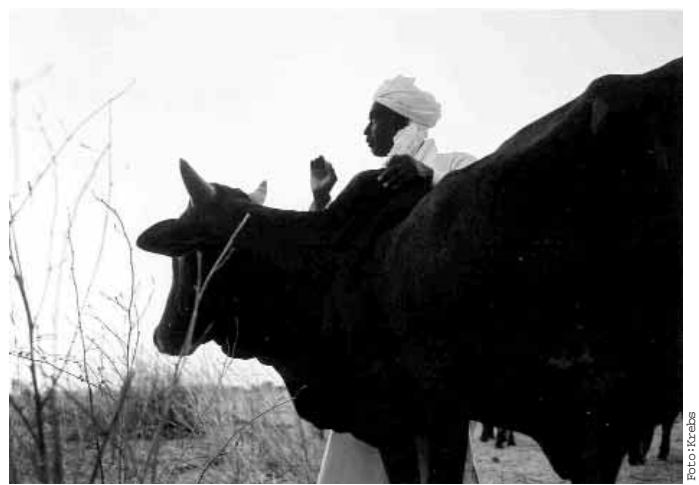
Die „perfekte Kuh“, so Ly, habe nichts mit der Milchleistung zu tun. Vielmehr sei ihr Charakter ausschlaggebend dafür, ob sie ihrem Halter Glück bringt.

Die Peul haben ihre Rinder – zarte, kleine Tiere mit Buckel und winzigen Eutern – immer schon nach Kriterien ausgesucht, die westliche Viehzüchter wohl schmunzeln lassen. Doch der Peul betrachtet das Rind als seinen Bruder, und da gelten andere Regeln. Die Grösse der Kuhherde ist ein Gradmesser für die gesellschaftliche Stellung. Allerdings leidet die Buschlandschaft zunehmend unter den wachsenden Viehbeständen. Immer mehr Bäume sind bis zur Fresshöhe abgeweidet. Und sollte die viermonatige Regenzeit einmal ausbleiben, wie vor zehn Jahren schon einmal geschehen, droht eine Katastrophe grössten Ausmasses. Weder für Mensch noch Tier sind Vorräte dar. Die-