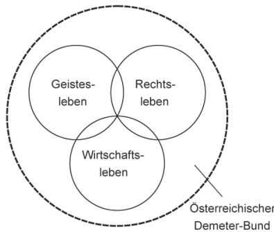
Abb. Symbol der Dreigliederung-Die Rosette

In der Generalversammlung konnte durch den Festvortrag von Nikolai Fuchs und die Darstellung der Arbeit bei der Klausur durch die Gruppe selbst etwas von diesem Impuls mitgeteilt werden. Die Anwesenden konnten eingebunden werden und können nun ebenfalls die Arbeit an der Verwirklichung der Anre-